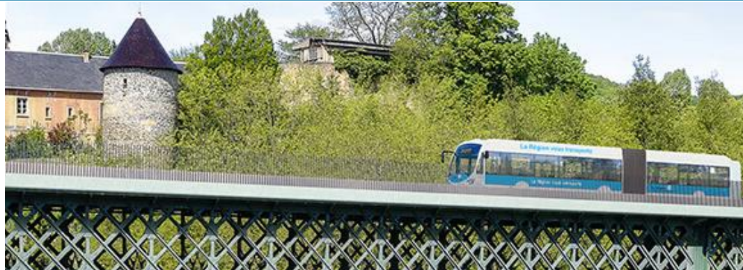
© Viaduc de Rochetaillée - https://www.auvergnehonealpes.fr/actualites/le-bhns-entre-trevoux-et-lyon-de-z

Lancé en 2019, le projet de Bus à Haut Niveau de Service (BHNS) a pour ambition de relier Trévoux à Jules Favre en une heure à l'horizon de fin 2027. D'une longueur de 28km dont 18 sur l'ancienne voie ferrée, le trajet prévu passe en plein milieu de l'ENS du Ruisseau du Ravin. Alors que les espaces boisés de l'ENS sont classés ce qui « interdit tout changement d'affectation ou tout mode d'occupation du sol de nature à compromettre la conservation, la protection ou la création des boisements. » (Articles L.113-1 et L.113-2 du code de l'urbanisme).